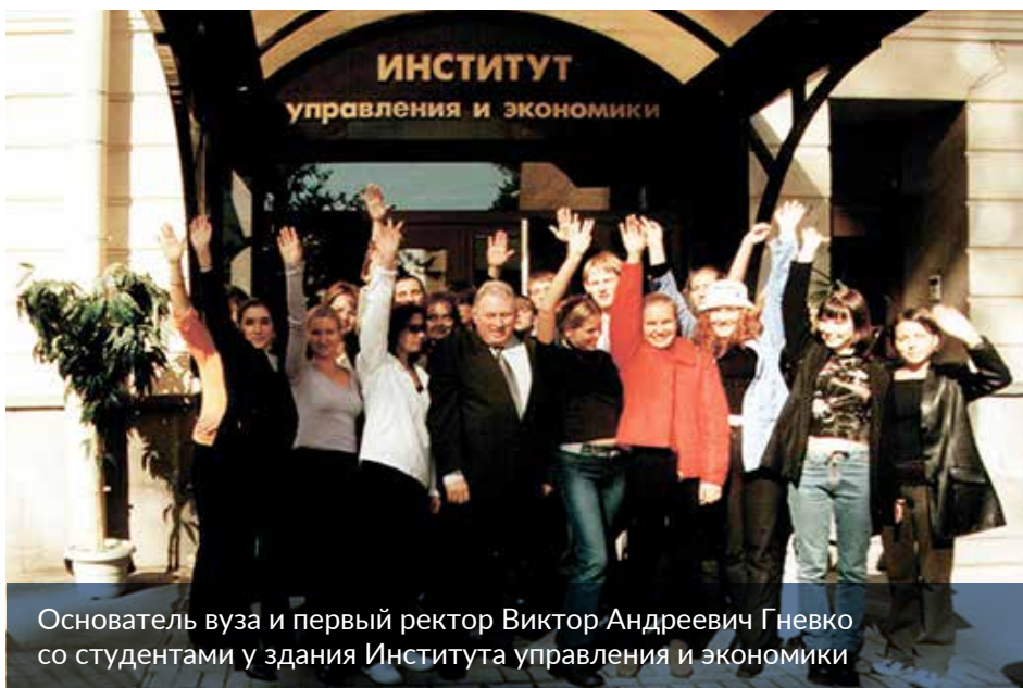
Основатель вуза и первый ректор Виктор Андреевич Гневко со студентами у здания Института управления и экономики

30 лет – срок в сравнении с возрастом Санкт-Петербурга небольшой, однако, для вуза, уверенно развивающегося в современную динамичную эпоху, это немало. Санкт-Петербургскому университету технологий управления и экономики принадлежит достойное место на странице истории нашего города, которая пишется сегодня. Чтобы вспомнить, какими мы были, загляните в архивный альбом.