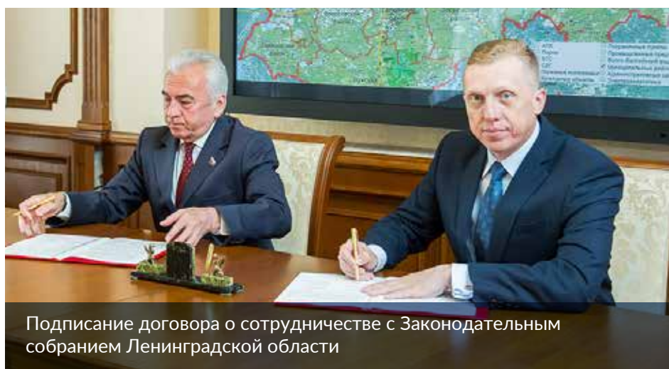
Подписание договора о сотрудничестве с Законодательным собранием Ленинградской области