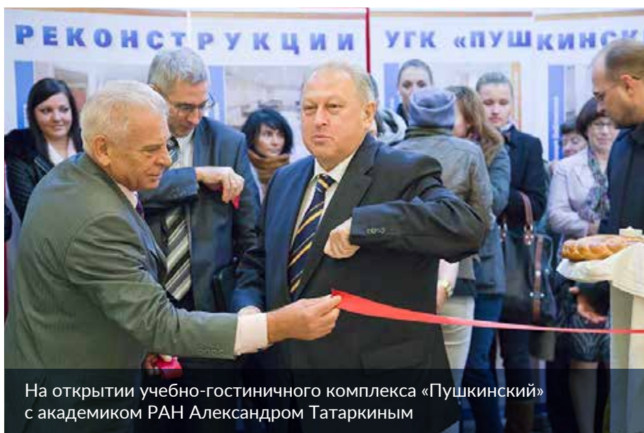
На открытии учебно-гостиничного комплекса «Пушкинский» с академиком РАН Александром Татаркиным