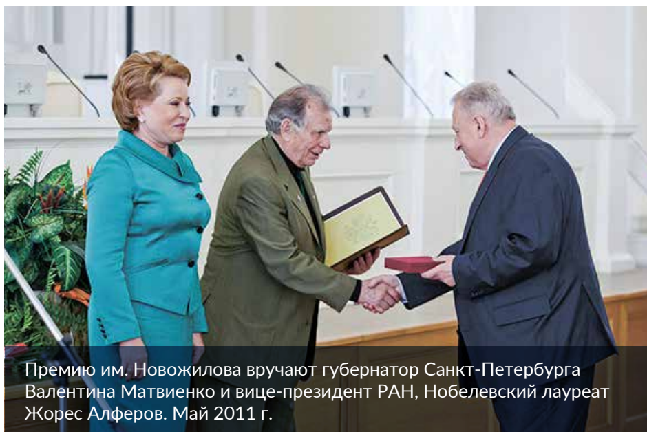
Премия им. Новожилова вручают губернатор Санкт-Петербурга Валентина Матвиенко и вице-президент РАН, Нобелевский лауреат Жорес Алферов. Май 2011 г.