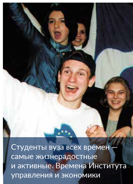
Студенты вуза всех времен — самые жизнерадостные и активные. Времена Института управления и экономики