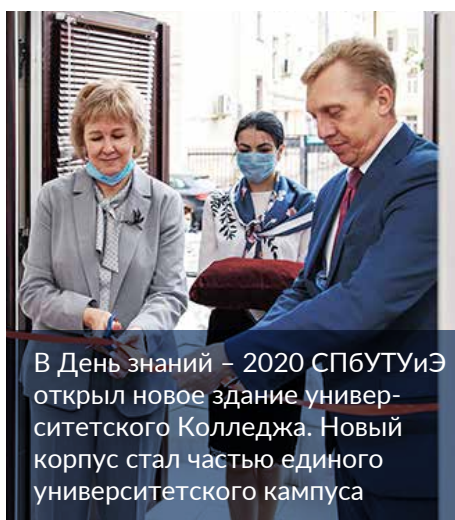
В День знаний – 2020 СПБТУИЭ открыл новое здание университетского Колледжа. Новый корпус стал частью единого университетского кампуса