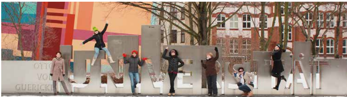
Студенты на обучении в Школе немецкого языка и культуры при Университете Отто-фон-Герике в городе Магдебург (Германия). Март 2013 г.