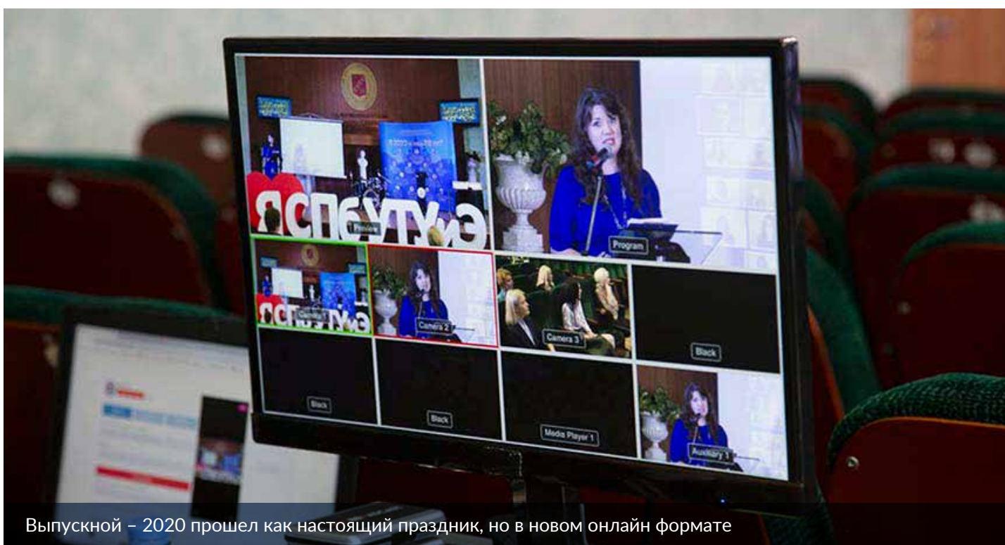
Выпускной – 2020 прошел как настоящий праздник, но в новом онлайн формате