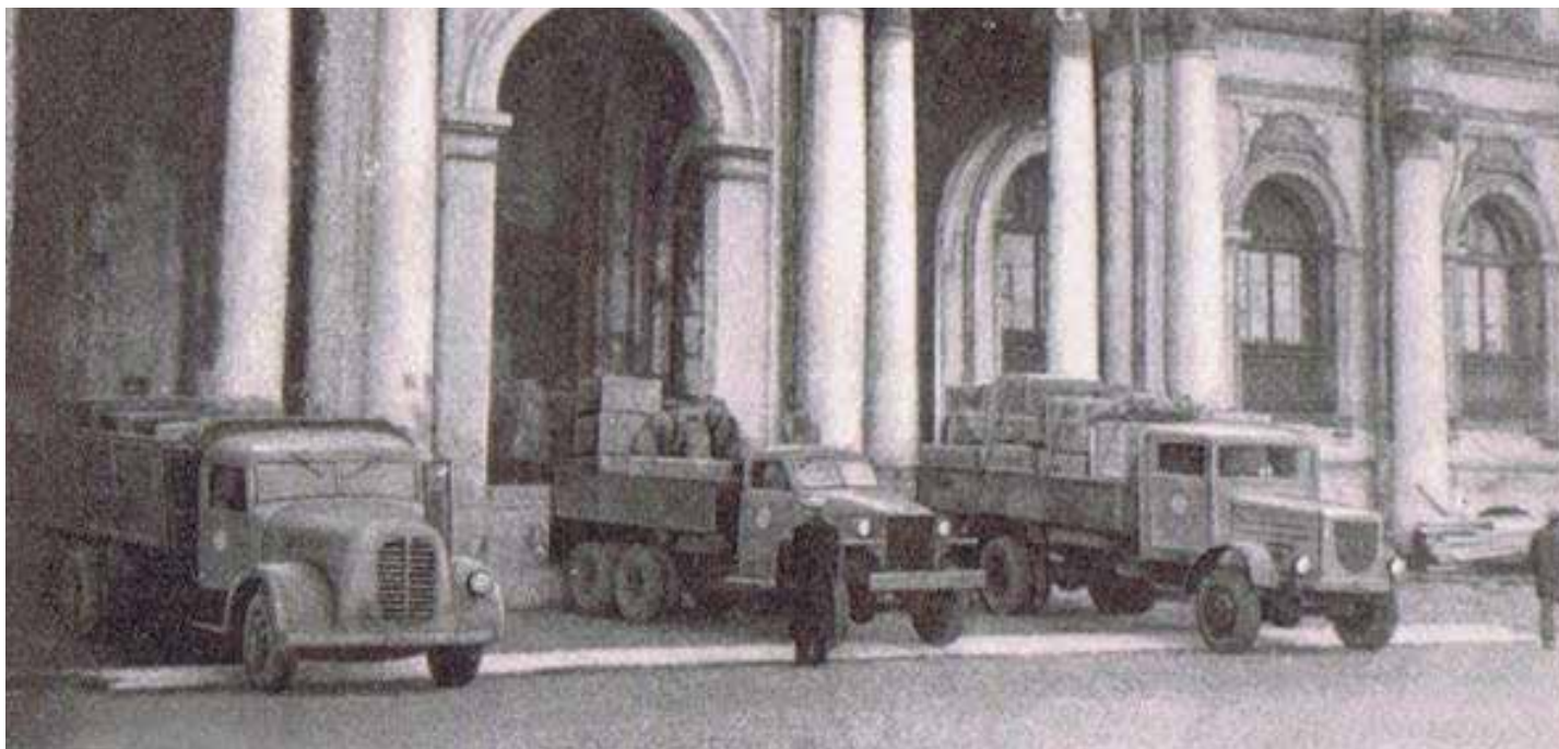
Возвращение коллекции в Эрмитаж. 1945 г.

Использованные материалы: С. Варшавский и Б. Рест «Подвиг Эрмитажа», 1969 г. vnu4ka.livejournal.com diletant.media