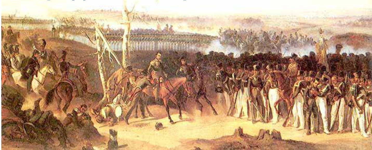
Лейб-гвардии Измайловский полк при Бородино. Картина художника А.Е. Коцебу, середина XIX в.

Крупнейшее сражение между русской армией под командованием генерала М. И. Кутузова и французской армией Наполеона I Бонапарта состоялось 26 августа (7 сентября) у села Бородино, в 125 км от Москвы. В битве при Бородино воины лейб-гвардии Измайловского полка открыли себя неувядаемой славой.