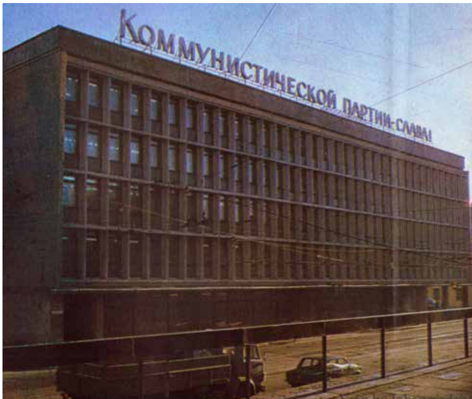
Здание проектного института «ГИПРОБУМ» — арх. Бебешко Г. Р., Вересов В. В., Гиндзбург И. З. (1962 год)