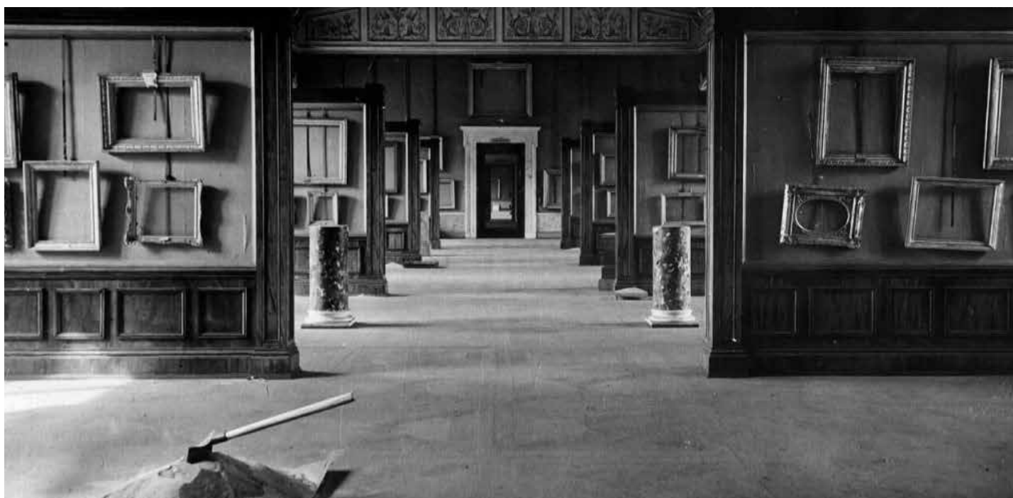
Зимний дворец Эрмитажа, Гербовый зал. 1942 г.

Даже война не смогла прервать научную и просветительскую работу музея: в Эрмитаже читались лекции, устраивались небольшие исторические выставки. Во время блокады в Эрмитаже было проведено →