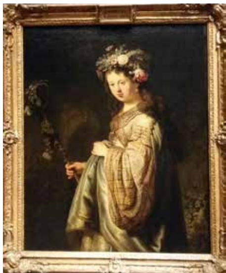
«Флора». Рембрандт. Картина из экспозиции Эрмитажа

→ несколько экскурсий. Правда, на стенах висели пустые рамы, картины вывозили без них, так было удобнее. «Но при этом они, пустые рамы, напоминали посетителям о полотнах», – отмечает директор Эрмитажа Михаил Пиотровский.