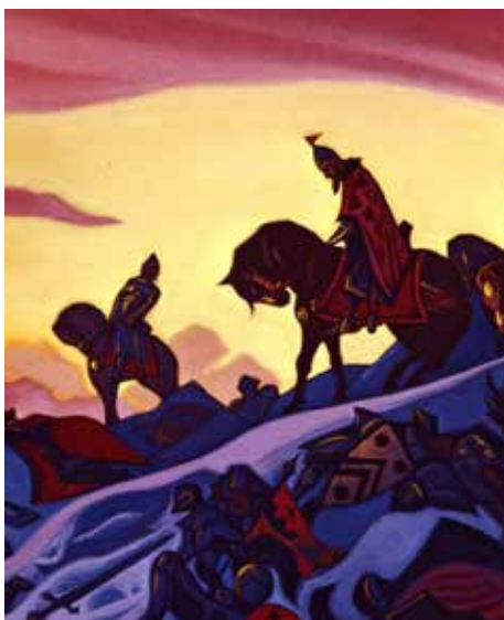
Фрагмент картины Николая Рериха «Александр Невский» (1942)

В том же году Ливонский орден предпринял наступательную операцию на русские земли. Его войска взяли Изборск и Псков. Оценив опасность, новгородское вече в 1241 году вновь призвало недавно изгнанного Александра на княжение. Князь собрал дружину и выступил против ливонцев. В марте 1242 года он сумел освободить Псков. Александр двинул свои войска к владениям Ордена, в сторону Дерптского епископства, где крестоносцы собрали значительные силы. Стороны готовились к решающей схватке.